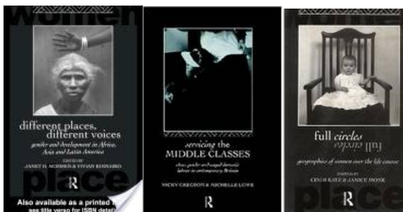
Abbildung 2: Umschlagvorderseite von 3 Bänden der Reihe International Studies of Women and Place des Routledge Verlags

Diese Buchserie wird von Janice Monk und Janet Momsen ko-editiert und soll aktiven Mitgliedern der Commission sowie anderen feministischen GeographInnen Gelegenheit bieten, ihre Arbeit in einem grossen und renommierten Verlag zu veröffentlichen. In der Vergangenheit sind in dieser Reihe einige sehr bekannte und auflagenstarke Werke publiziert worden (siehe unten stehende Fotos). Eine extreme Hochpreispolitik des Verlags verhindert leider in jüngerer Zeit, dass finanziell weniger gut ausgestattete Bibliotheken (ganz zu schweigen von Privatpersonen) sich diese Bände leisten können oder wollen.